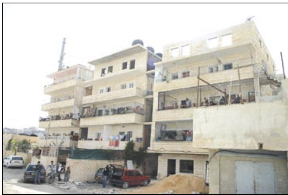
٣ بنايات سلم اصحابها وامر اخلاء اسرائيلية في رأس شحادة جنوب مخيم شعفاط.